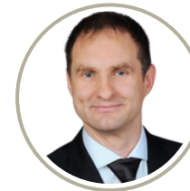
RENÉ KARRASCH HANSE Interim GmbH