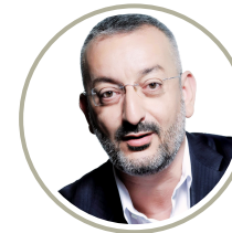
DR. BODO ANTONIC GOINTERIM GmbH